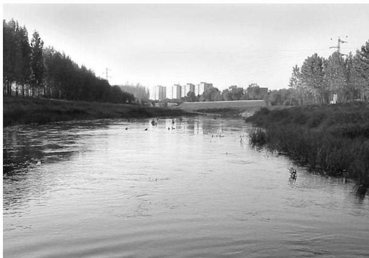
A Zagyva Szolnoknál