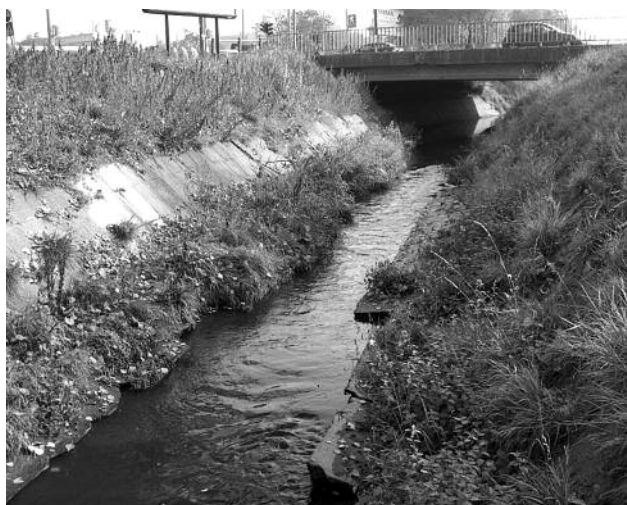
A Rákos-patak betonozott medre

A Gödöllői-dombságból eredő, Budapesten Dunába ömlő Rákos-patak már csak betonozott medre miatt sem mondható természetközeli vízfolyásnak. Vizének szennyezettsége a '80-as és '90-es években olyan mértékű volt, hogy semmiféle hal nem maradt meg benne. Egy évtizede azonban biztató jelek mutatkoztak: a patak pesti, torkolatközei szakaszán két igénytelen faj, az ezüstkárász és a razbóra már megjelent.