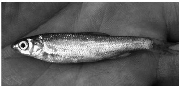
A Zagyvából fogott nyúldomolykó

2009. szeptember 3-án természetvédelmi szempontból értékes halfajok után kutattunk a Zagyvában. Jászfényszarunál, a Zsámbok felé vezető közúti híd felett mintegy 300 méterrel egy fiatal, nyúlánk, ezüstös színezetű halat sikerült fognunk, melyet félig alsó állású szája, valamint az oldalvonal mentén megszámlálható pikkelyek alapján nyúldomolykónak ( Leuciscus leuciscus ) határoztunk.