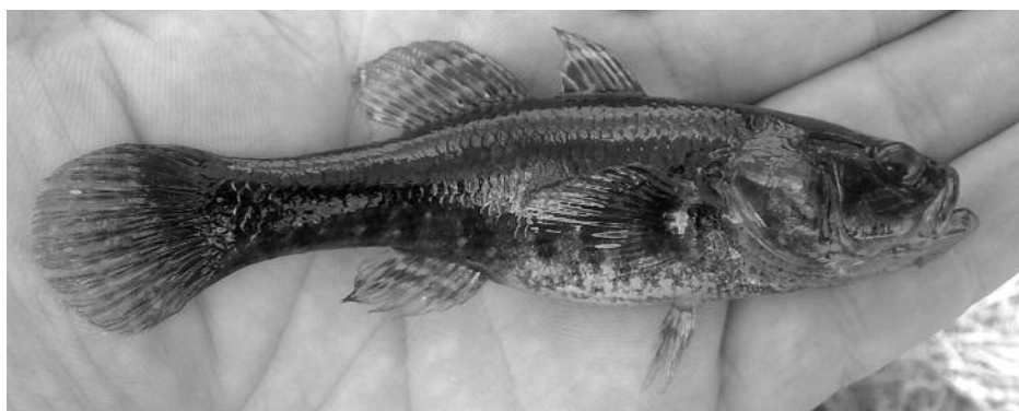
Amurgéb a Kálló-főcsatornából

A faj további terjeszkedése a Berettyó teljes hazai szakaszán és vízgyűjtőjén is valószínű, ami ko-