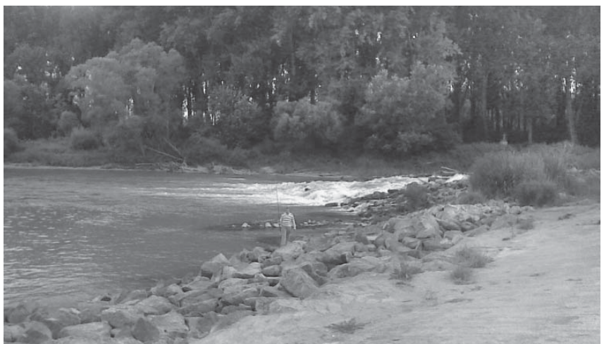
Nyáron harcsás, télen menyhalas pálya Ásványrárón

csodákat művelhet. Ívási időszakban (november-december) rapszodikus a fogási esélyük. Van úgy, hogy nem lehet horogra csalni őket, de előfordul, hogy egy tucat is jön belőlük. Ívás után, januárban ismét vehemensen vetik magukat az élelem után. Éjjel több hullámban is jöhetnek a rajok, elég közel a parthoz. A telihold ritkán hoz jó kapást, kivéve, ha borús az idő. Egy fontos szabály: Ahol jön a bucó, ott lesz este a menyhal is!