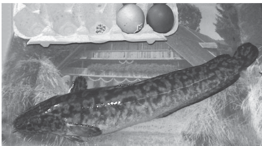
Tálcán a húsvéti menyhalak egyike

ken szebb példányok akadtak horgóra, az Öreg-Duna azonban meglepetéseket is tartogatott számomra. Az egyik évben például harcsázni indultunk, kifejezetten nagyot szerettünk volna fogni, hisz a kisebbeket amúgy is tilalom védte, mivel már május 8-át írtunk. Egy gilisztacsokorral csalizott szereléken kapás, bevágás, fárasztás után az eredmény egy 41 centiméter hosszú menyhal lett. Azt hittem, rosszul látok. Kíváncsiságból ott, helyben megtisztítottam, s fenyitottam a gyomrát. Tele volt apró rákocskákkal! Tehát nem alszik, hanem eszik! Tavaly is előfordult, hogy harcsázás közben – április közepén, akkortájt volt húsvét – menyhalakat