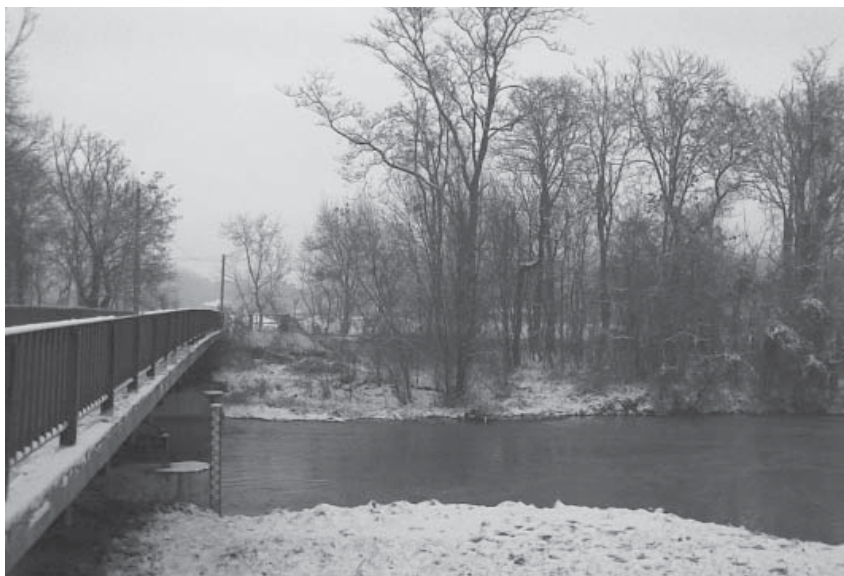
A Lajta hídja alatti visszaforgó több méretes (30-45 cm) menyhalat ad minden évben

Ezek után a Szigetköz következett, az ágrendszerek, zsilipek, hídlábak. Tizenöt menyhalas helyem lett, válogathattam, hogy mikor, hova menjek. Az elzártabb, nem háborgatott része-