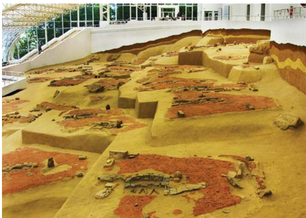
Az áthelyezett leletegyüttes a kunyhók nyomaival (Fotó: Harka Ákos)

A több mint 130 kunyhóból álló vízparti falu nyomaira a tervezett víztározó kialakítását megelőző régészeti feltárás során bukkantak rá Donji Milanovac közelében. Feltárása sok érdekességgel szolgált az archeológusok számára, félig embert, félig halat sejtető szobraik, hal-szerű emberfejet formázó faragott kőveik máig talányosak. Mivel a duzzasztással megemelkedő víz elárasztotta volna a közéneolitikumi települést, a feltárást követően a leletegyüttest 30 méterrel följebb helyezték a hegyoldalon. Egyidejűleg hatalmas üvegsarnokot emeltek föl, hogy védjék az időjárás viszontagságaitól.