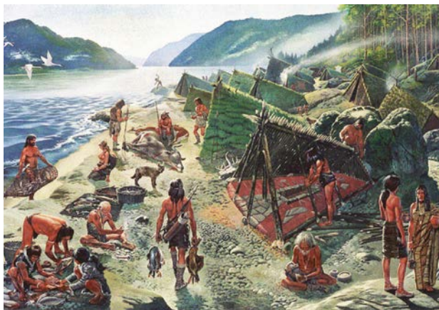
Giovanni Caselli fantáziaképe a telep életéről

Elődeink nyilván nem véletlenül telepedtek meg Duna egyik halban leggazdagabb szakaszán. A fantáziakép vesszővarsában ficánkoló, kosárba gyűjtött, gyékényszőnyegre terített vagy éppen felpucolás közben látható halai jól jelzik, hogy milyen fontos szerepet játszott őseink mindennapi táplálékában ez a fontos fehérje-, vitamin- és ásványianyag-forrás.